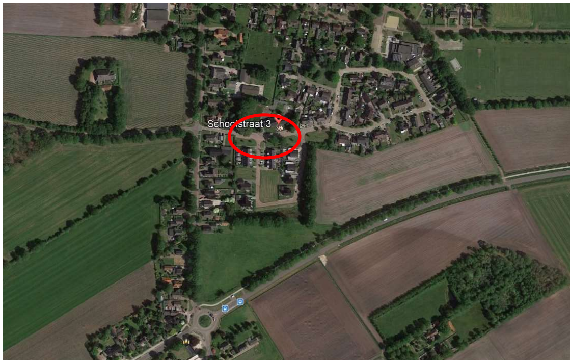
Afbeelding 1.1: Situatie.

In de voorliggende rapportage zijn de resultaten weergegeven voor situatie versie 4 van KAT KOREE Architecten. In afbeelding 1.1 is een overzicht opgenomen van de situatie.